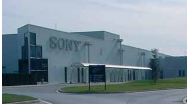
Sony assegura la càrrega de treball fins al 2009

Regularment es repeteixen anuncis de possibles deslocalitzacions d'empreses al nostre país. Així, al mes de setembre vam sentir que Sony planejava obrir una planta per fabricar televisors LCD a Eslovàquia. Aquest avís comportava una lleugera incertesa entre els treballadors i treballadores del centre Sony BCN Tec, a Viladecavalls (Vallès Occidental), on també es fan televisors i es dissenyen nous productes. El comitè, encapçalat per CCOO, va reclamar que aquestes "informacions" no s'utilitzessin com a fórmula de desestabilització amb vista a les negociacions del conveni col·lectiu, i va recordar els seus propòsits: solucionar els problemes de contractació i millorar les condicions socials i econòmiques de la plantilla, formada per gairebé 2.500 persones, entre fixes i temporals.