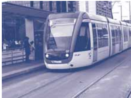
CCOO es felicita de la inauguració de la línia 5 del tramvia de Barcelona.

Una altra bona notícia ha estat la inauguració de la nova línia L-5 del tramvia de Barcelona, concretament del Trambesòs, que dona un nou impuls a aquest mitjà de transport ja que augmenta progressivament el nombre d'usuaris. De tota manera, CCOO recorda que manca encara la resta de la línia fins a l'estació del Gorg, a Badalona, i la connexió prevista fins a l'estació de Sant Adrià, per acabar d'acomplir el desplegament programat del Trambesòs.