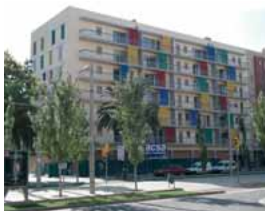
Hem demostrat la nostra capacitat i garantia fent habitatge assequible a Catalunya

En reivindicar la tasca d'Habitatge Entorn, estem reivindicant un espai per a la concertació pública-privada i per al cooperativisme, no suficientment valorat encara.