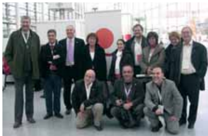
La delegació de CCOO

Els principis sobre els quals es construeix la CSI són els del sindicalisme democràtic, independent i pluralista. Com és obvi, això significa deixar de banda les adscripcions ideològiques partidàries, que han estat en la base de la divisió sindical, així com posar per davant uns objectius