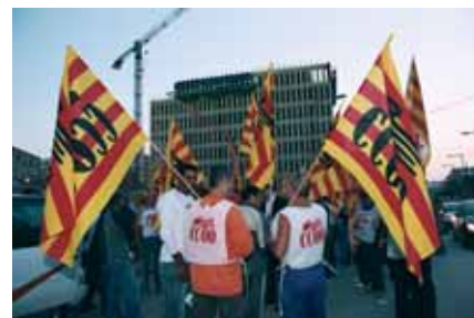
La huelga de la construcción paralizó la mayoría de las obras en la provincia de Barcelona.

Entre los temas más importantes que recoge su articulado, podemos citar que las empresas del sector deberán acreditar que, por lo menos, un 30% de los trabajadores de la empresa tiene un contrato de carácter indefinido; se limita a tres niveles la cadena de subcontratación; se crea un registro de empresas acreditadas para luchar contra los piratas y prestamistas, que sólo se dedican a la cesión de trabajadores a bajo pre-