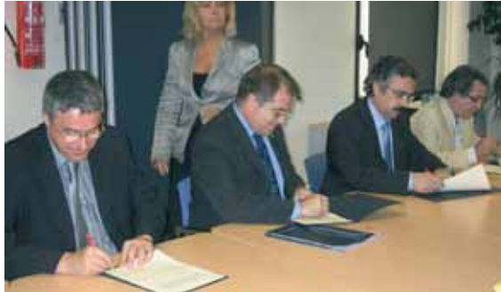
Un moment de la signatura

Per a nosaltres, ha estat sempre un punt essencial, envers aquest sector i en les nostres negociacions, mantenir el continu reciclatge dels treballadors i treballadores en noves tecnologies i sistemes de producció, en disseny, i, en general, en tot el que pugui portar a mantenir els llocs de treball dins del tèxtil i la confecció. És per això que hem aconseguit del Govern de la Generalitat la signatura d'un nou acord marc i la promoció d'un nou programa d'ajuts que garanteix a les persones afectades per futurs expedients de suspensió de contractes, una formació que els permeti accedir a una millora de la seva formació i qualificació a fi i efecte que puguin disposar dels mitjans de readaptació necessaris per als nous processos productius. En aquesta línia, per tant, serà necessari que, en els expedients de regulació