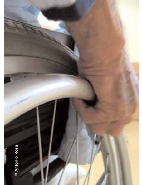
El pressupost previst per al 2008 per a polítiques socials és clarament insuficient

La Llei de dependència estableix dues modalitats d'atenció: per una banda la prestació directa de serveis i, per una altra, les prestacions econòmiques, entre les quals les vinculades a la compra d'un determinat servei. La Generalitat ha fixat la quantia d'algunes d'aquestes prestacions en uns percentatges inferiors als límits màxims establerts per la Llei a escala estatal. Tot i que la norma determina la prioritat de la prestació de serveis sobre l'econòmica, en la pràctica moltes vegades no es podrà accedir a serveis com ara places de residència pública, atesa la poca oferta i l'alta demanda existent. En aquest cas s'haurà d'acceptar la prestació econòmica vinculada a la compra d'una plaça de residència, prestació que resultarà insuficient per fer front al cost real de la plaça. CCOO considera que, en el cas que no es pugui oferir un servei, la quantitat econòmica ha de garantir la compra del servei en el mercat privat. Altrament, l'increment del pressupost previst per al 2008, de només el 10% respecte al del 2007, resultarà clarament