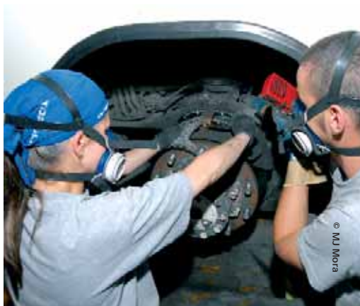
Hem d'aconseguir la igualtat salarial per a feines d'igual valor

En la Trobada de negociadors i negociadores vam agafar el compromís de posar la lluita per la igualtat efectiva en els centres de treball com un dels tres eixos estratègics. Per això cal que col·lectivament assumim aquest compromís, de manera que l'elaboració de les plataformes reivindicatives sigui un reflex d'aquesta voluntat d'una forma clara i rigorosa, i donant-li el valor que mereix a l'hora de la negociació.