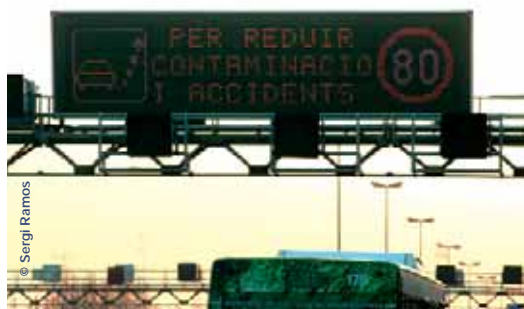
Ja són visibles mesures per la millora del medi ambient

Cada cop és més evident l'impacte del canvi climàtic sobre determinades activitats econòmiques, com el turisme, la gestió de l'aigua i de l'energia o l'agricultura. CCOO hem d'atendre aquest problema de manera decidida i amb criteri propi, i així ho fem. Ningú millor que nosaltres defensa el paper dels treballadors, que no ha de ser el de contemplar com les empreses s'aferren a sistemes productius obsolets i ineficients. Des del sindicat hem de promoure canvis cap a models més nets, segurs i amb futur, potenciant una transició ordenada, socialment justa i ambientalment sustentable.