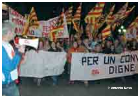
Els professionals de la sanitat privada han dit prou a la seva situació laboral

El conveni del sector de la sanitat privada ofereix unes condicions laborals molt precàries, amb salaris baixos i jornades excessives i perllongades. A més, la dotació de personal és molt