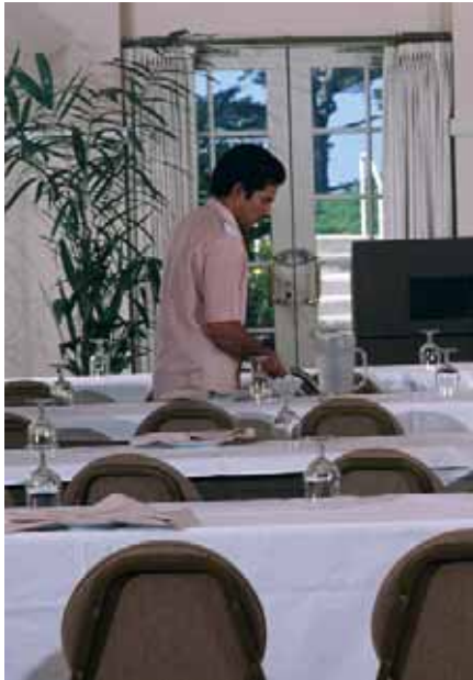
CCOO lluita contra els baixos salaris estructurals en sectors com l'hostaleria