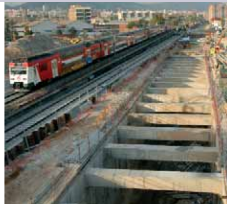
És evident que les grans infraestructures avancen

El 2008 també serà l'any en el qual avancin molt les obres del metro de Barcelona. Les estacions i els traçats més avançats han de comportar una millora important per a la mobilitat en barris molt populars; el dubte que tenim pel que fa a traçats és tot el que