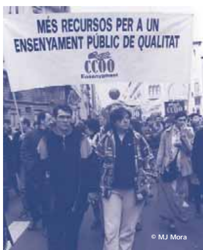
El 14 de febrer l'ensenyament públic va viure una jornada de vaga en contra de la Llei catalana d'educació

Davant d'aquesta proposta, CCOO actuarem perquè la futura Llei catalana d'educació reculli els objectius del Pacte Nacional, que ha de significar fer més pública l'escola concertada i no més privada l'escola pública.