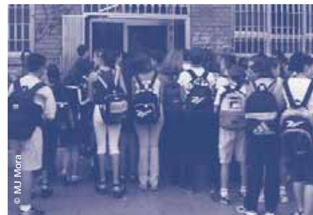
La massificació a les aules és un dels principals problemes a les escoles

Aquest dèficit evidencia una manca de planificació, que se suma a la manca d'inversions del Departament d'Educació, que, entre d'altres mesures, ha congelat els recursos de funcionament dels centres, l'increment dels quals formava part de la memòria econòmica del Pacte Nacional per a l'Educació. A més, no s'ha informat els representants dels treballadors del pla d'estalvi que va aprovar el Govern al mes de juliol, ni tampoc de quines repercussions tindrà per a l'educació i les persones que hi treballen. En matèria de personal, s'han congelat els recursos humans per als programes d'innovació educativa i no s'ha presentat convocatòria per a nous contractes programa amb els centres concertats.