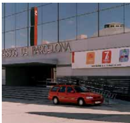
El Palau de Congressos de Barcelona acollirà novament el nostre Congrés, com fa vuit anys

Però el camí del Congrés ja porta un llarg recorregut. Des del 28 de maig, data en què el Consell Nacional de la Comissió Obrera Nacional de Catalunya va aprovar la convocatòria del Congrés, s'han elaborat els documents congressuals, que ja han estat debatuts en les diferents assemblees en empreses i altres assemblees conjuntes d'afiliats d'empreses més petites. Ara, fins al 16 de novembre, estant tenint lloc els congressos i les conferències de federacions i unions territorials. De tots aquests processos