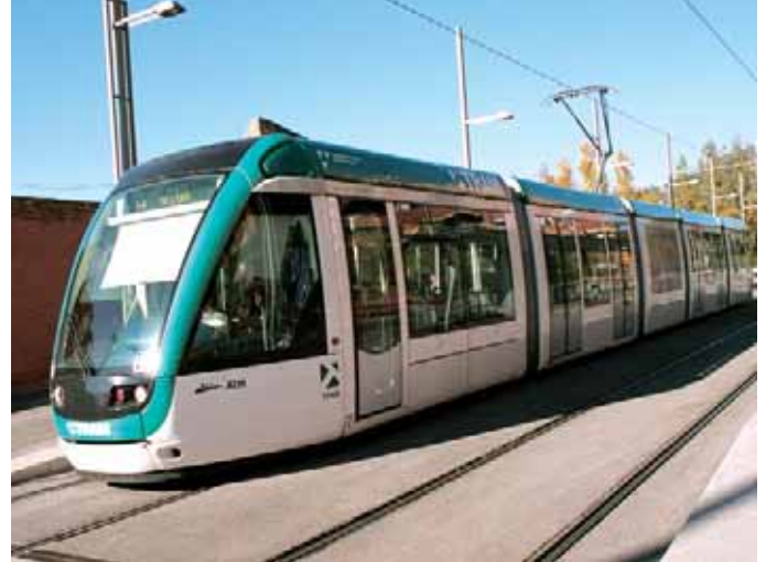
El de Barcelona deixarà de ser l'únic tramvia interruptus d'Europa

Amb aquest projecte s'aconsegueix dotar la ciutat de més transport públic eficient, i proporcionar una accessibilitat