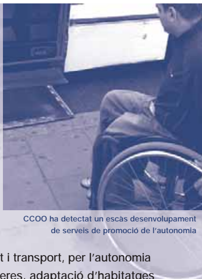
CCOO ha detectat un escàs desenvolupament de serveis de promoció de l'autonomia

Després d'un injustificat endarreriment, el 31 de juliol es va aprovar la Cartera de serveis socials, essencial per al desenvolupament de la Llei de serveis socials de Catalunya. CCOO ha detectat un escàs desenvolupament dels serveis de promoció de l'autonomia. Així, els ajuts per mobilitat i transport, per l'autonomia personal i la comunicació, supressió de barreres, adaptació d'habitatges i aparells tècnics no estan garantits i estan sotmesos a disponibilitat pressupostària. Tampoc es garanteix el transport adaptat a les persones amb dificultats de mobilitat, factor clau per fer efectiu l'accés a determinats serveis garantits. A més, la Cartera de serveis socials aprovada no defineix suficientment la figura del professional de referència, permet sotmetre a copagament serveis com el servei d'atenció domiciliària i la teleassistència, no s'estableixen criteris únics respecte a la intensitat dels serveis, estàndards de qualitat, acreditació i perfils professionals ni es fixa el nombre de professionals necessaris per nombre d'usuaris amb referències temporals.