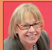
Maria Badia (PSC)

Des d'ICV i el Grup Verd Europeu, creiem que és necessari que els estats membres cedeixin sobirania a la UE, però ens oposem frontalment al fet que els governs cedeixin la sobirania de la ciutadania als mercats. Per això reclamem un nou model de governança econòmica, alhora que ens oposem a decisions antisocials, antieconòmiques i antidemocràtiques com el Pacte per l'euro plus o la reforma constitucional imposada per PP i PSOE. Ho vam dir quan al març s'aprovava el Pacte per l'euro i ho vam demostrar en les nostres votacions al Ple del Parlament Europeu del passat mes de juny: creiem que el Pacte és una fal·làcia per construir una Europa neoliberal, on s'adopten mesures en favor dels bancs i les grans corporacions. On són les emissions d'eurobons? O una política fiscal comuna? Són qüestions que no interessin als poderosos i per això no van ser incloses; en canvi reclamem més precarietat laboral o rebaixes de salaris. Sobre la legitimitat de la UE, és imprescindible més pes del Parlament, única institució de la UE escollida de manera directa. Però també cal la participació de la ciutadania, i la creació d'espais d'acord i concertació amb presència d'organitzacions socials i sindicals. ■