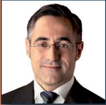
Ramon Tremosa (CiU)

El passat 28.09.2011 el Parlament Europeu va aprovar el paquet legislatiu de governança econòmica de la zona euro. Aquest paquet, per a mi un salt qualitatiu en la gestió de les finances públiques de la zona euro a escala europea, obligarà a una major disciplina pressupostària i sancionarà durament tant el dèficit públic excessiu com la manipulació de dades estadístiques oficials per part dels estats membres. El paquet legislatiu s'ha aprovat amb majories més àmplies i transversals del que s'havia previst: grups conservador i liberal-demòcrata però també molts socialistes i verds des dels països nòrdics (Holanda, Finlàndia...). Aquest paquet legislatiu suposa un primer pas cap a la unió fiscal de la UE i era la precondició que els països nòrdics demanaven als països del sud per començar a parlar dels eurobons (paraula màgica en boca de molts però que no suposarà una barra lliure de nova despesa pública).