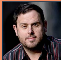
Oriol Junqueras (ERC)

de drets. Pot guanyar així Europa la confiança dels ciutadans? Si parlem de legitimitat, és suficient el paper del Parlament Europeu?".