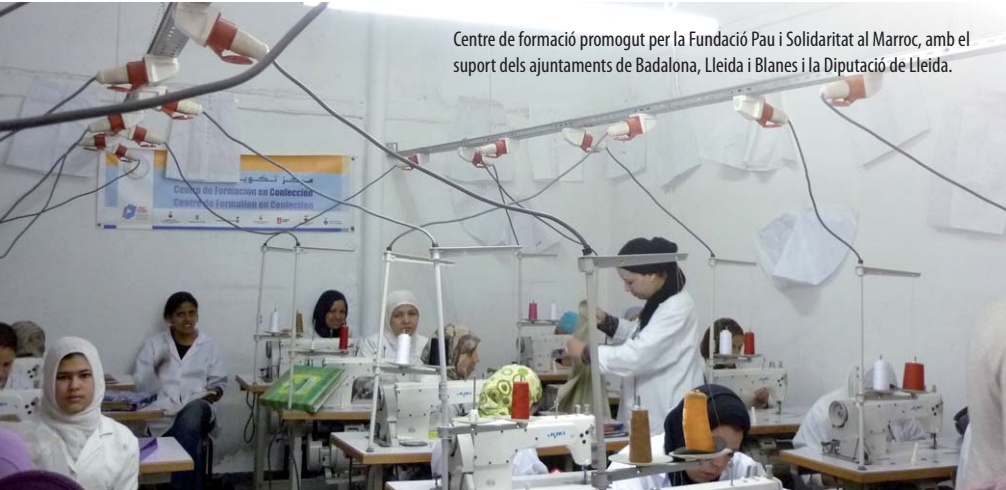
Centre de formació promogut per la Fundació Pau i Solidaritat al Marroc, amb el suport dels ajuntaments de Badalona, Lleida i Blanes i la Diputació de Lleida.