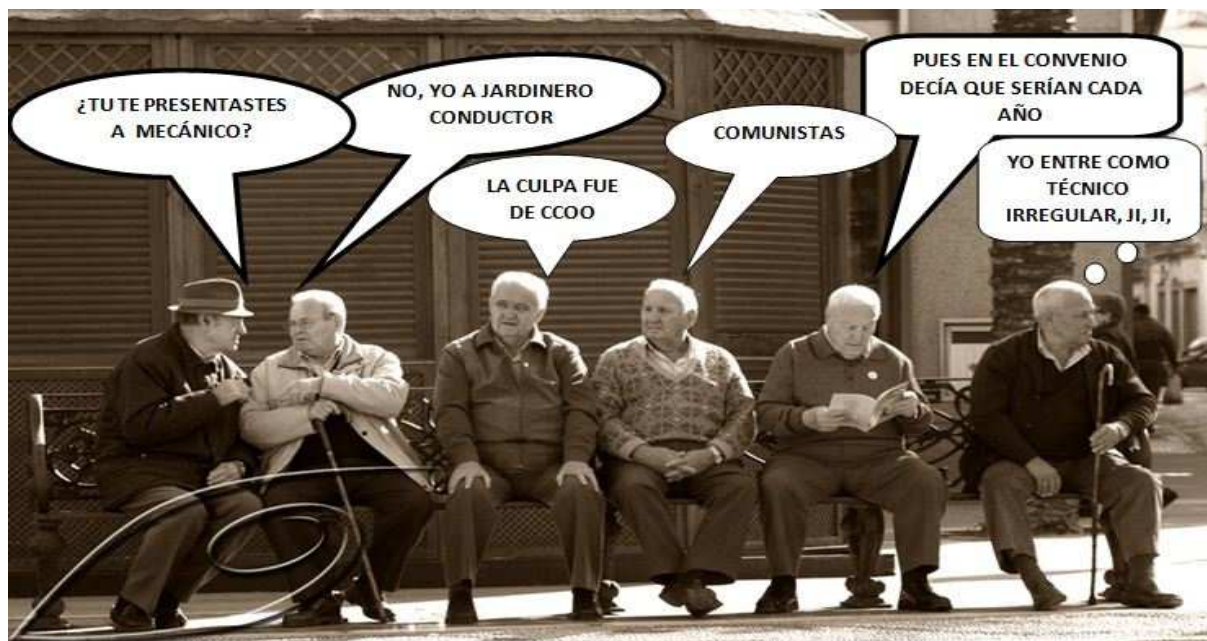
AÑO 2045 TRABAJADORES DE PARCS I JARDINS ESPERANDO LAS PROMOCIONES INTERNAS

En Parcs i Jardins también se ha avanzado y evolucionado, aunque eso no ha llegado a las Promociones Internas. En el siglo pasado, cuando dirigía el Instituto " Il Capo di tutti capi ", las Promociones Internas, por llamarlas de alguna manera, funcionaban al más puro estilo siciliano de la